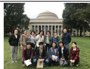
ホストンキャンパスツアー